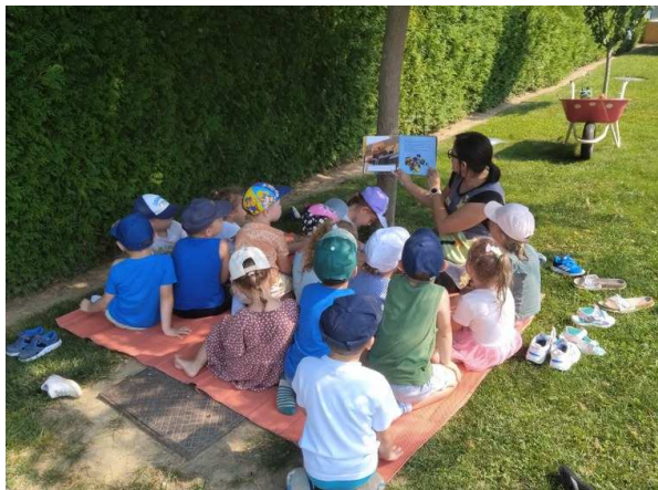
Ljetne aktivnosti DV Čarolija od 01.07. 2024. – 31.08.2024.